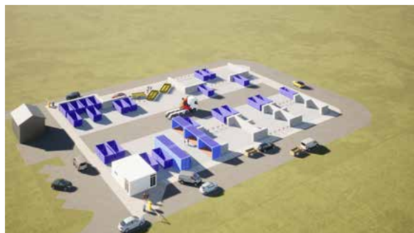
Projet de déchetterie fixe à Fontaine